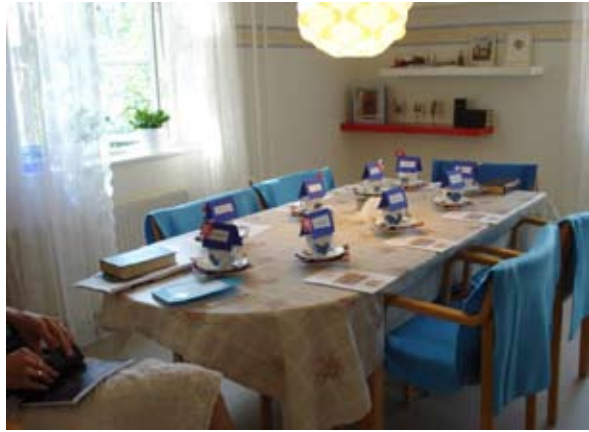
Her er bordet dækket til gruppen "Salmesang - kirkens højtider og traditioner". I baggrunden ses nogle af hylderne til udstillinger.