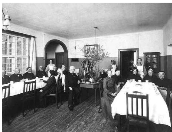
Frederiksberg. Stockflethsvej 4-6. Frederiksberg Alderdomshjem. Frederiksberg Alderdomshjem (maj 1909).

I august 1898 blev det vedtaget at lægge alderdomshjemmet ind under hospitalet og indrette det i den sydlige halvdel af en bygning der lå ud mod Stockflethsvej (der hvor der på et tidspunkt var en fødeafdeling). Det blev taget i brug den 1. december 1903 og havde 28 stuer med 25 senge.