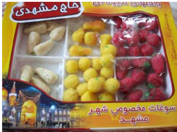
Jytte Munch Petersen havde kager/slik med fra Iran.