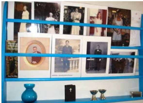
Den blå tallerkenrække bruges nu som led i udstillingerne. Her er der billeder til temaet om konfirmation, foruden et par alterbægre, en salmebog og en æske med "Mannakorn".