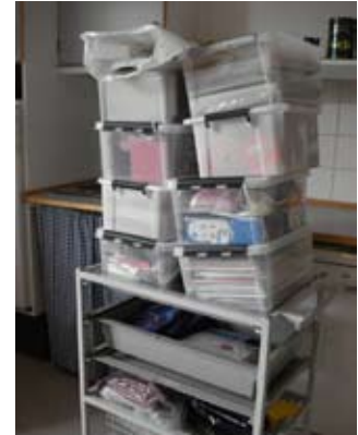
Nogle af kasserne med indhold.