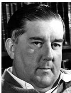
Ib Christian Albert von Cotta Schønberg (kaldet "Ibbermand"), født: 23. oktober 1902 i København; død: 24. september 1955 i Skodsborg, var en folkekær dansk