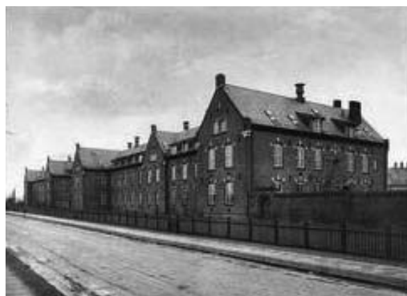
Stockflethsvej 4-6, maj 1909. Frederiksberg Alderdomshjem og længere nede ad vejen Frederiksberg Børneoptagelseshjem.

Fra den 1. november 1904 blev bygningens kvistetage helt inddraget til alderdomshjem, hvorved pladsantallet blev forøget med 30. Der fandtes herefter i alt 55 pladser fordelt på 21 stuer, foruden 2 opholdsrum og en opholdskorridor.