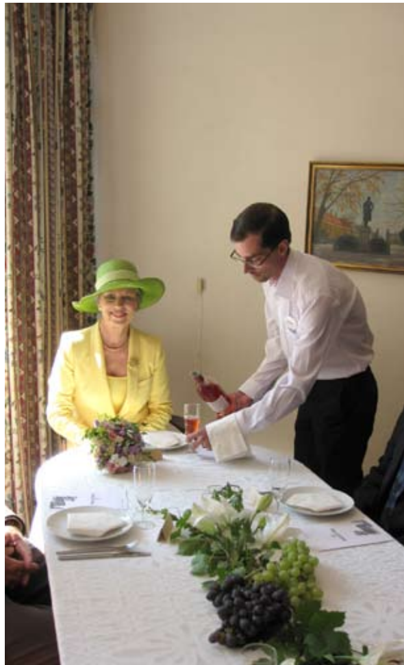
Der serveres for Hendes Kongelige Højhed prinsesse Benedikte.