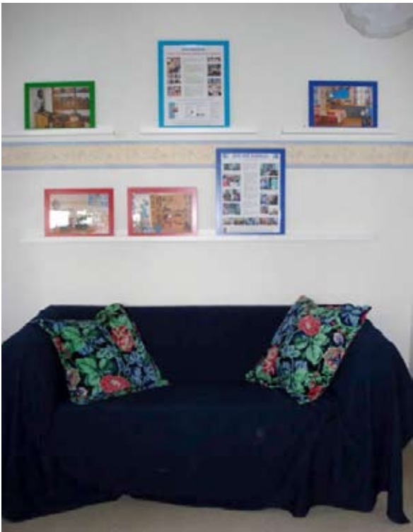
Gallerihylderne over sofaen.