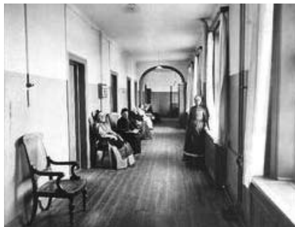
Frederiksberg. Stockflethsvej 4-6. Frederiksberg Alderdomshjem. Frederiksberg Alderdomshjem. Korridor (maj 1909).

På dette tidspunkt havde kommunen 1.153 alderdomsunderstøttede personer. Heraf var 38 på alderdomshjemmet. Gennemsnittet pr. forplejningsdag var 133 øre.