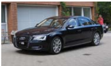
"Kronebilen" på vej.