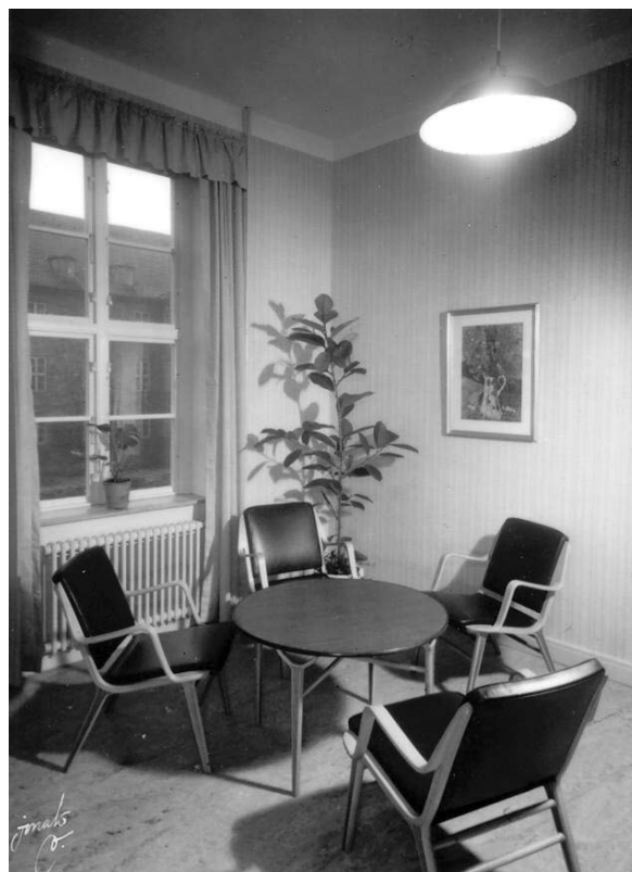
En af dagligstuerne på det gamle alderdomshjem.