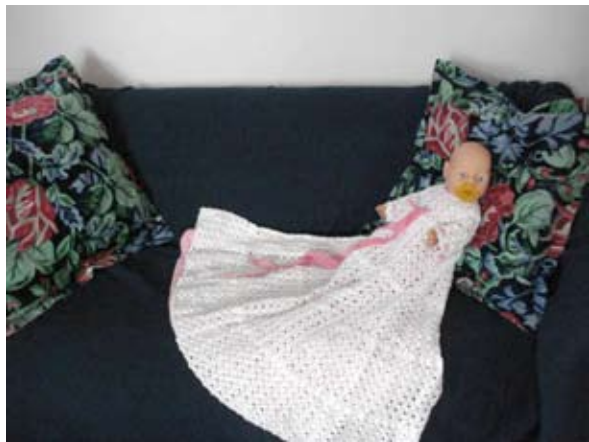
Fra temaet om dåben.