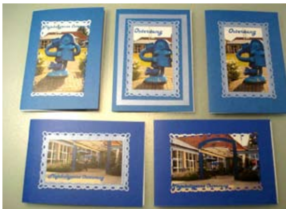
Kort med Østervang på.

De kort der laves om mandagen kan købes i Cafeen, der er både kort med mange forskellige motiver med Østervang foruden specielle og individuelle kort kan bestilles om mandagen i gruppen i Cafeen.