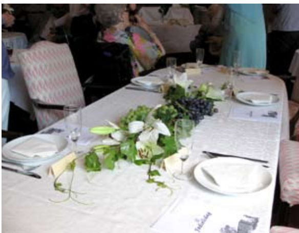
Det smukt dækkede bord.