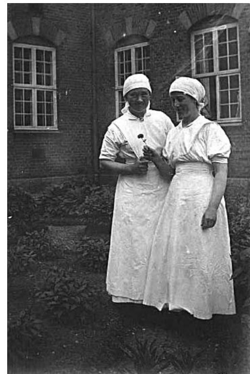
To sygeplejersker fotograferet i haven til Vestervang, ca. 1918.

I 1915-16 var de alderdomsunderstøttedes antal steget til 2.043 personer. Alderdomshjemmet kunne nu tage 70 personer fordelt på 24 stuer. Der var 2 opholdsrum og 1 opholdkorridor. Gennemsnitsudgiften var nu pr. belægningsdag steget til 185 øre.