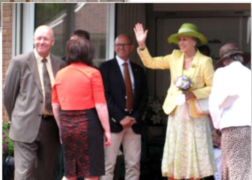
Så er Hendes Kongelige Højhed prinsesse Benedikte ankommet.