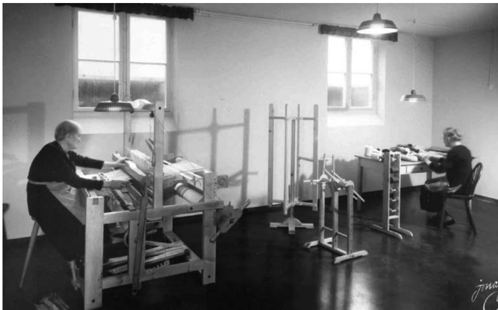
Frederiksberg Kommunes Aldersdom- hjem, væve- stuen.

dagen for pårørende til borgere der skal flytte på plejehjem, var der en datter, der havde læst om reminiscens på Østervangs hjemmeside. Hun fortalte, at hun ud fra det, havde fået en ide. Hun ville lave tre personlige erindringsæsker til sin mor: En "Afrika æske", fordi moderen i sin barndom havde boet flere år i Afrika, med nogle af de ting hun havde fra den tid, en "Barndomsæske" med ting fra hendes barndom og en "Haveæske" med frøposer, kataloger, have- og blomsterbilleder fordi moderen havde holdt meget af sin have og havearbejde.