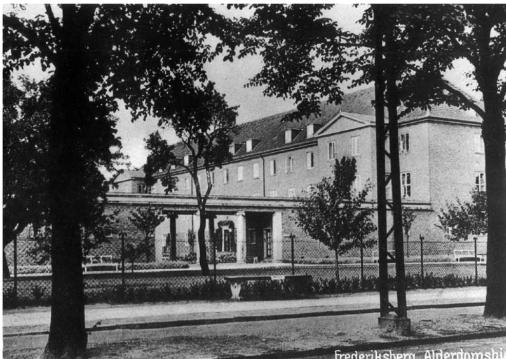
Plejeboligerne Østervang hed dengang Frederiksberg Kommunes Alderdomshjem. Her er et billede (set fra Godthåbsvej) inden Loggiaen blev tilføjet.

"Maden bringes os fra det gamle hospital og køres på de små hospitalsmadvogne ad en makadamiseret vej [en type vejbelægning bestående af grus og sten i forskellige stør-