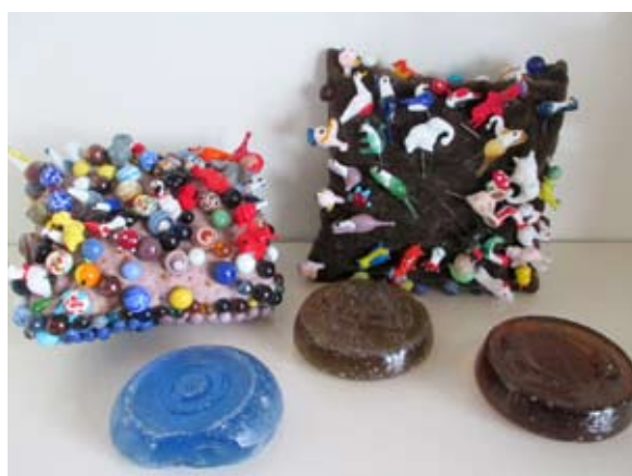
Nipsenåle og hinkesten.