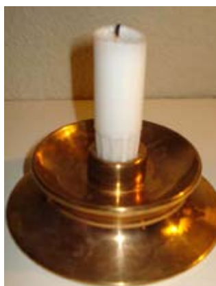
Lysestagen er lavet af det hjul der sad over på ledningsstangen på sporvognen - den stang der kunne "hoppe af", hvor passagerne så måtte vente til den var sat på plads igen, før sporvognen igen kunne køre.