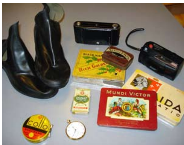
Lidt af det en passagerer måske kunne have på/med: galocher, fotografiapparat, et lommeur, lidt at ryge på (det var jo dengang man måtte ryge på bivognen). Skosvæerte, der blev brugt inden man gik hjemmefra, da skoene altid skulle være nypudsede.