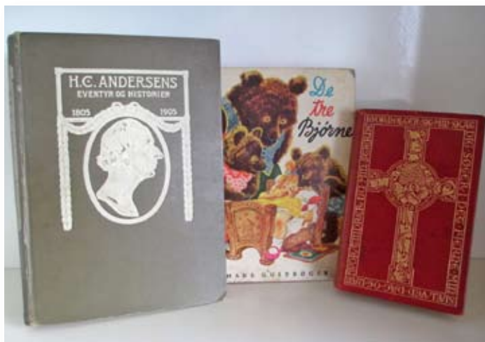
De bøger jeg har med i erindringskassen.

Allerede meget tidligt i min barndom fik jeg læst højt af min mormor, det var blandt andet H.C. Andersen, Hjortens Flugt, Terje Vigen og selvfølgelig også af "guldbøgerne", for eksempel Tre små bjørne, så litteraturen skulle helt sikkert med.