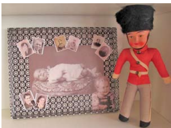
Den Tivoli-gardist jeg fik under mit første besøg i Tivoli.