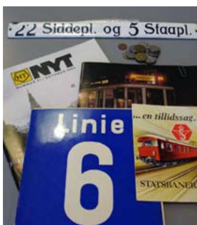
Brochurer, poletter og et emaljeskilt fra en sporvogn med teksten "22 Siddepl. og 5 Staapl."