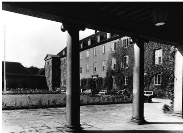
Frederiksberg Kommunes Alderdomshjem, Vestfløj og Kolonnaden.