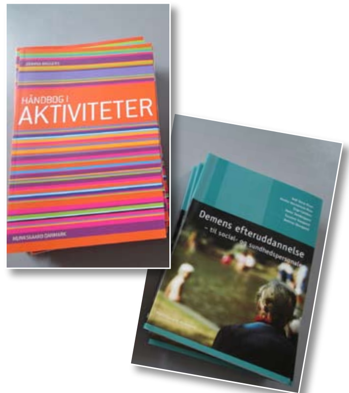
Bøgerne, der er beskrevet i artiklen.