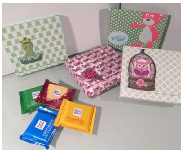
Chokoladeæskerne med 4 stk. chokolade i.