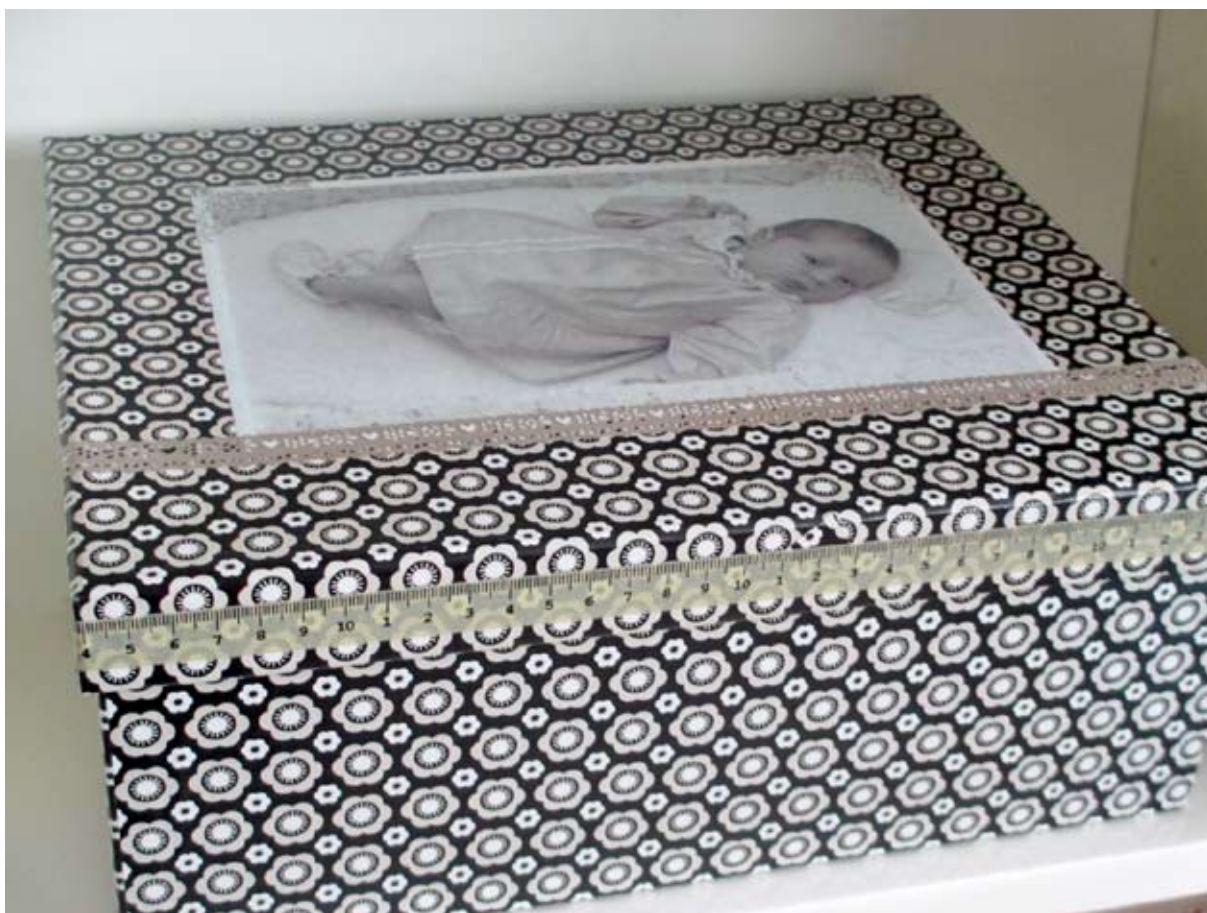
Min egen barndoms erindringskasse.

Jeg er jo født før fjernsynets tid, så der blev spillet rigtig meget: Ludo, Skidtmads,