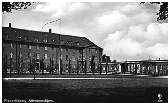
Frederiksberg Kommunale Alderdomshjem, Vestfløjen, før Loggiaen blev bygget.