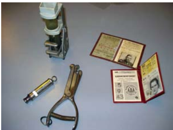
Poleholder, metalfløjte, klippetang og 2 abonnementskort.