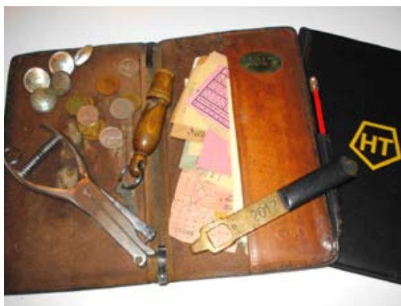
Nr. 2017 - hans billetmappe, både fra Sporvejene og HT, hans klippetang, træfløjte og nøglen til forvognen - også med nr. 2017.