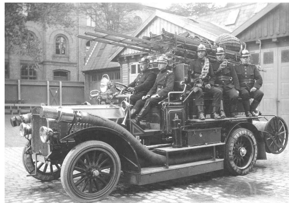
Motorsprøjte i 1925.

1932: Den nye Brandsstation på Howitzvej tages i brug, og den gamle station anvendes til rådhusformål.