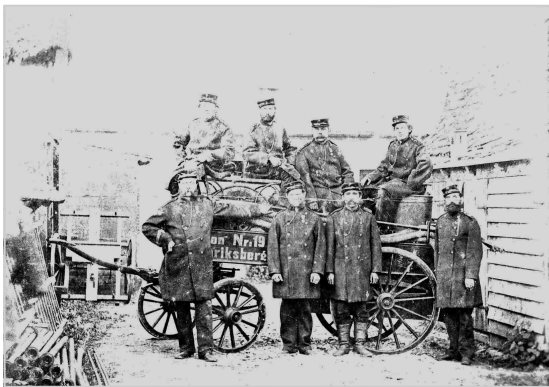
Brandsprøjten ved Brandstationen ved Pile Allé i 1881.

1886: Den nye brandstation, der er en del af det gamle rådhus på Howitzvej/Falkoner Allé tages i brug.