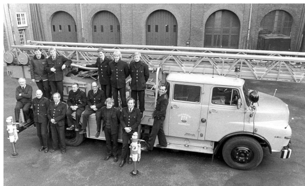
Stigevogn på den "nye" brandstation i 1981.

1980: 3 nye sprøjter og en ny drejestige anskaffes.