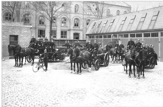
Vognparken i 1909 fotograferet i Brand- stationens gård bag ved rådhuset ved Fal- koner Allé/Howitzsvej.

1923: Brandvæsenet bliver en særlig afdeling under Den tekniske Forvaltning.